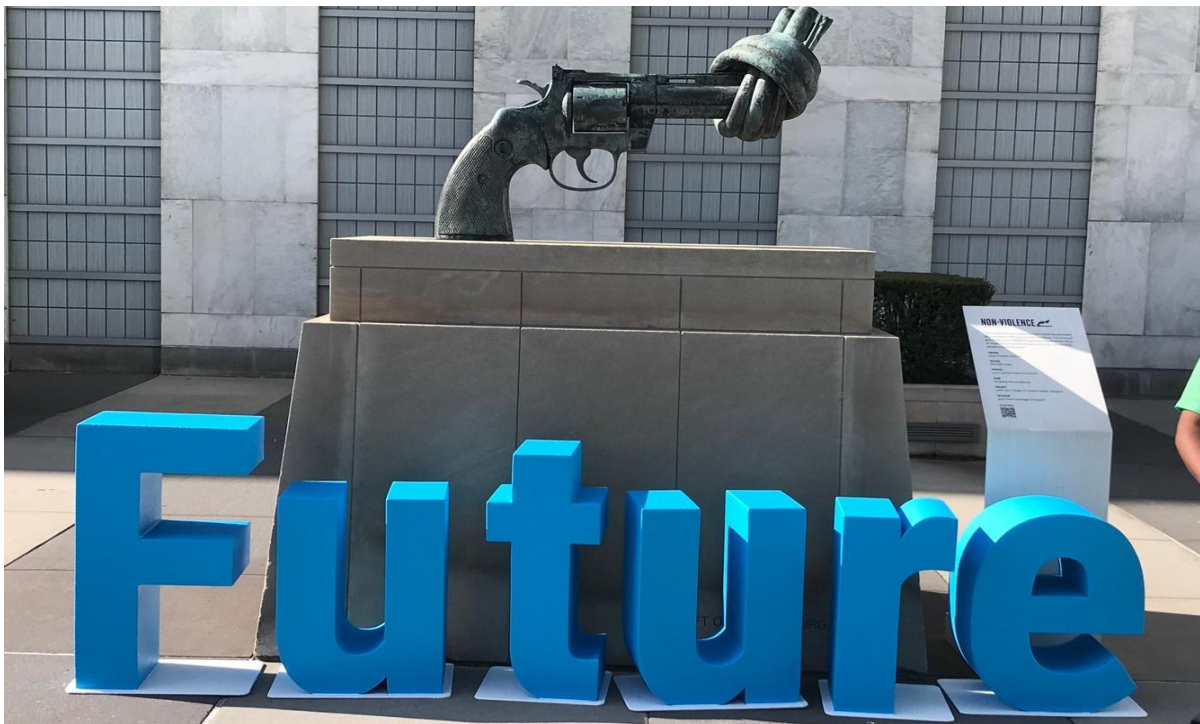
Summit of the Future, UN HQ, New York.

Die Vereinten Nationen veranstalteten vom 22. bis 23. September im Rahmen der UN-Generalversammlung den durch Deutschland und Namibia vorbereiteten Zukunftsgipfel („Summit of the Future“). Im Vorfeld des Gipfels wurden Aktionstage organisiert, die der globalen Zivilgesellschaft die Möglichkeit boten, auf ihre Perspektiven und weniger beachtete Problemlagen aufmerksam zu machen.