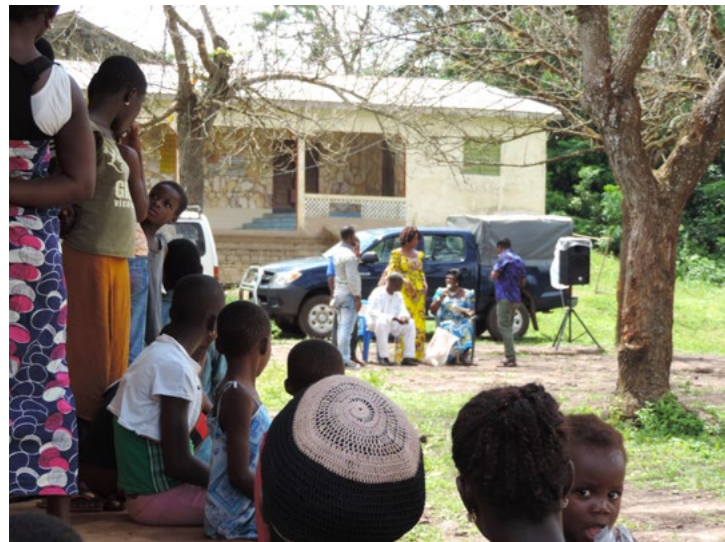
Fotos: Aufklärungsarbeit mit Sketches

den Projektpartner*innen in Afrika werden viele Menschen auf ganz unterschiedliche Herangehensweisen in Uganda, Burundi, Kenia, Togo, Burkina Faso, Simbabwe, Niger und dem Sudan erreicht. Die Teams informieren vor Ort über das Virus, den Verlauf der Krankheit und die Ansteckungsgefahren an Bushaltestellen und Marktplätzen, aber auch in Gesundheitsinstitutionen und Bildungseinrichtungen. Außerdem bieten die Partner*innen Betroffenen medizinische Hilfe, soziale und psychologische Unterstützung an; dies geschieht oft in Selbsthilfegruppen, kirchlichen