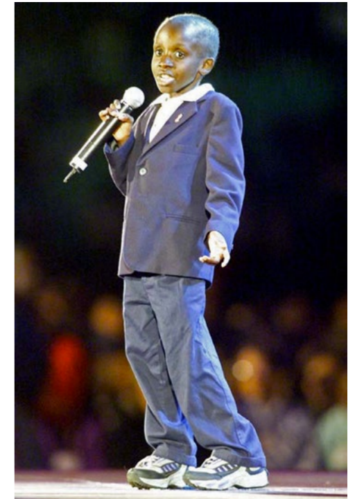
↑ Nkosi Johnson bei der Eröffnung der 13. Internationalen Aids-Konferenz in Durban, Südafrika am 9. Juli 2000

Es ist für Nkosi Johnson anders gekommen. Gesundheit ist ein Menschenrecht und eine politische und finanzielle Entscheidung. Dass Leugner*innen dabei im Wege stehen können, gehört zu der Geschichte von HIV. Ähnliches wiederholte sich während der COVID-19-Pandemie. ●