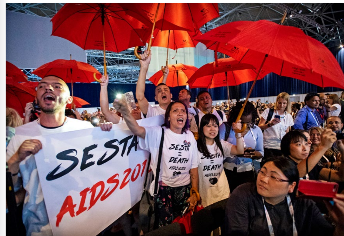
← Proteste während der Keynote des ehemaligen US-Präsidenten Bill Clinton während der 22. IAC in Amsterdam im Jahr 2018