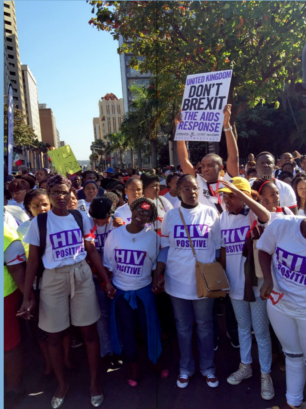
↑ Demonstration während der Welt- Aids-Konferenz in Durban 2016

Die durch UNAIDS gesammelten Daten erlauben es anderen Organisationen, mit zielgerichteten Programmen darauf zu reagieren. UNAIDS entwickelt dazu Standards zur Entwicklung und Umsetzung, basierend auf Menschenrechtsprinzipien und Zielgruppenorientierung, im Respekt gegenüber und in Einbindung der mit HIV lebenden Communities sowie gegründet auf dem aktuellen wissenschaftlichen Kenntnisstand. Das ist vor allem in Bezug auf tradierte Werte- und Moralvorstellungen und dem Diskriminierungspotential, dem Menschen mit HIV an vielen Orten ausgesetzt sind, überaus