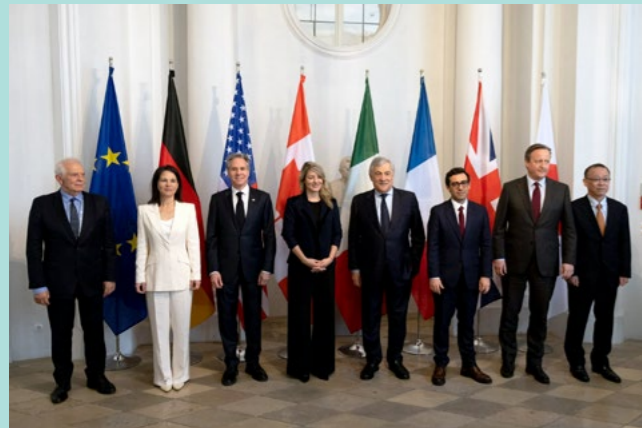
↑ Erstes Treffen der G7-Außenminister*innen unter italienischem Vorsitz am 17. Februar 2024 in München

Gerade auch deshalb hat sich das Aktionsbündnis bewusst dafür entschlossen, neben den Vereinten Nationen auch die informellen Austauschformate G7 und G20 zu adressieren, da hier potenziell sehr positive Signale gesetzt werden können. So sprechen sich die Regierungschef*innen in beiden Formaten meist für eine Unterstützung des Globalen Fonds aus. Dieses Momentum gilt es von zivilgesellschaftlicher Seite zu bestärken und einzufordern. ●